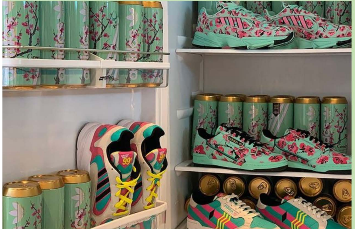
Adidas que se vinculó con el fabricante del té helado Arizona para producir zapatillas de deporte de 99 centavos

En la era de la hiperconexión, las marcas quieren estar conectadas con su público y para esto buscan una manera diferente de relacionarse, mucho más audaz y divertida, en la que los consumidores anhelan pertenecer y auto expresarse.