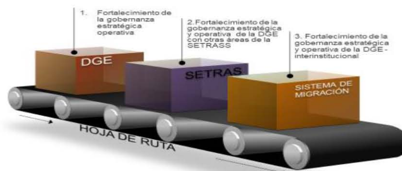
Ilustración 1 Ámbitos del fortalecimiento intra e interinstitucional

El fortalecimiento será necesario desarrollarlo en tres (3) fases, niveles o ámbitos, una que corresponda a las intervenciones a lo interno de la DGE, otra a la SETRASS y luego trascender al ámbito Interinstitucional, como se muestra en la siguiente figura: