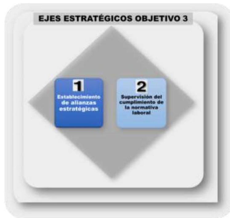
Ilustración 7. Ejes / Líneas Estratégicas del Objetivo Estratégico 3 (OE 3): Promover las Condiciones Favorables para la generación de Oportunidades de Empleo Verde

Para el Objetivo Estratégico 3, Promover las Condiciones Favorables para la Generación de Oportunidades de Empleo Verde se definieron los ejes estratégicos ilustrados a continuación y abajo descritos.