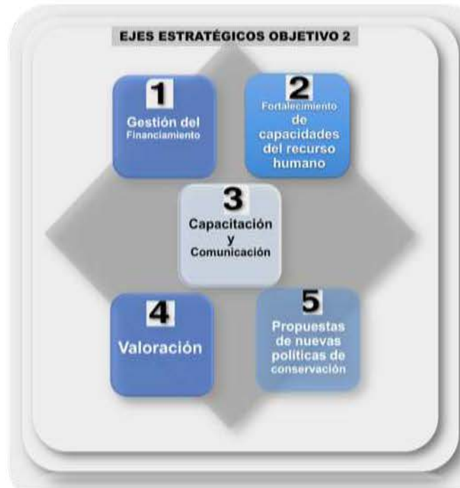
Ilustración 6. Ejes / Líneas Estratégicas del Objetivo Estratégico 2 (OE 2): Fortalecer la Gestión y el Manejo Técnico Administrativo de la Vida Silvestre

Para el Objetivo Estratégico 2, Fortalecer la gestión y el manejo técnico administrativo de la Vida Silvestre se definieron los ejes estratégicos abajo descritos y que se muestran en la siguiente ilustración.