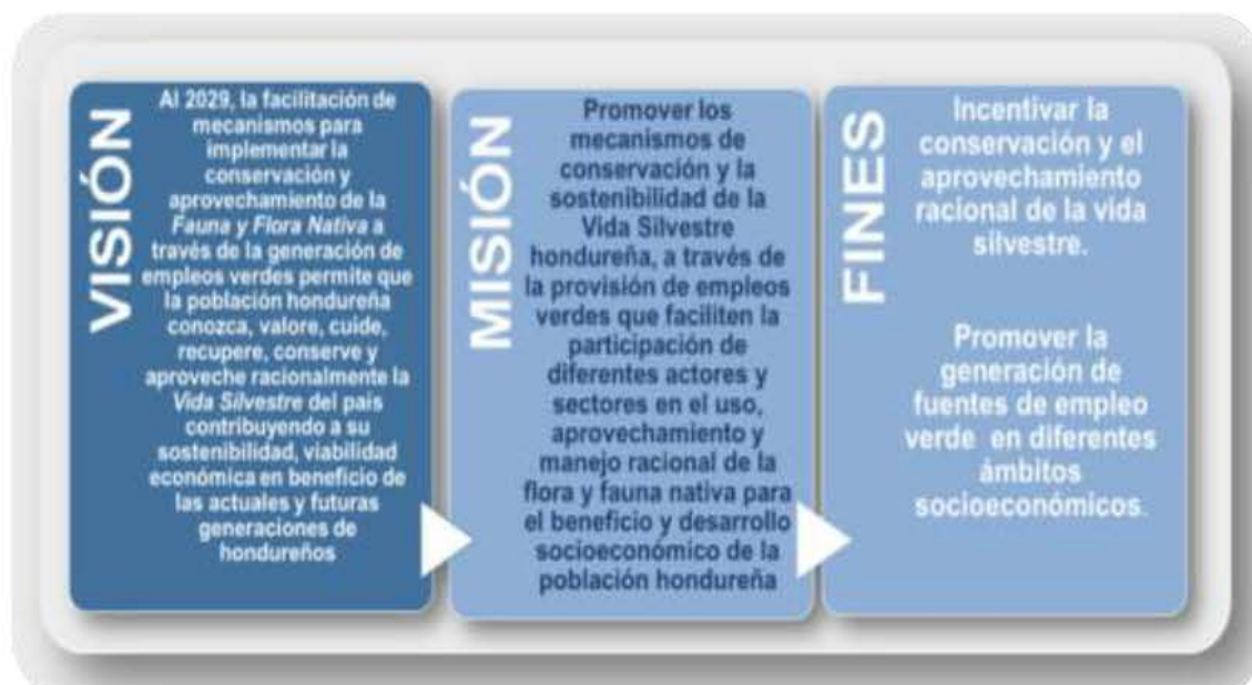
Ilustración 2. Visión, Misión y Fines Estratégicos de la ENCOAVIS – E

La siguiente imagen resume el direccionamiento estratégico (Visión, Misión y Fines Estratégicos) y en la siguiente tabla se agregan, a este direccionamiento estratégico los objetivos establecidos para lograr la conservación y el aprovechamiento racional de la vida silvestre a través de la generación de empleo.