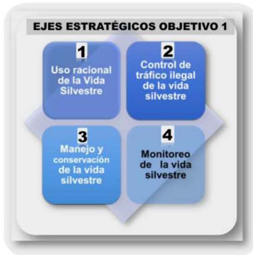
Ilustración 5. Ejes / Líneas Estratégicas del Objetivo Estratégico 1: Reducir la Presión sobre la Vida Silvestre, Aprovechándola de Manera Sostenible