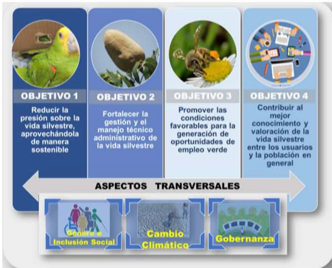
Ilustración 3. Objetivos Estratégicos de la ENCOAVIS – E

base a las competencias institucionales y tomando en consideración la misión, visión, los aspectos transversales del PEI de cada ente y la visión de país.