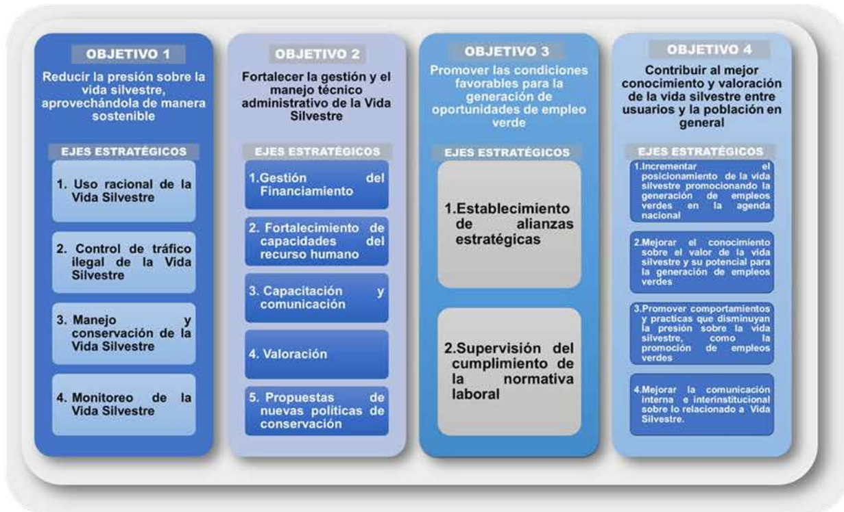
Ilustración 4. Ejes / Líneas Estratégicas por Objetivos Estratégicos de la ENCOAVIS – E