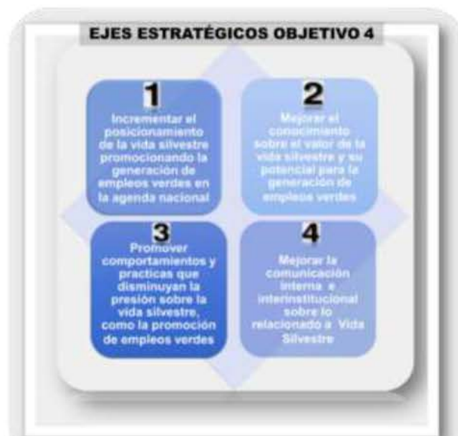
Ilustración 8. Ejes / Líneas Estratégicas del Objetivo Estratégico 4 OE 4

En este marco de acción los resultados esperados de este esfuerzo si bien es cierto se refieren al número de alianzas estratégicas suscritas, también se refieren al número de proyectos financiados y empleos generados.